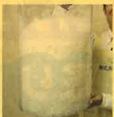
40グラムの足し羽毛です