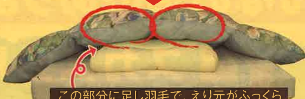
この部分に足し羽毛で、えり元がふっくら えり元に40グラムを足し羽毛後