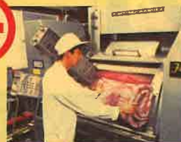
おふとんの丸洗い作業